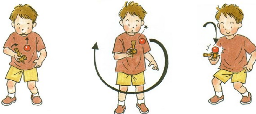
けんじりでカ～んと打ちます。 グルっと左回りに1周して、 飛んできた玉を大皿に。