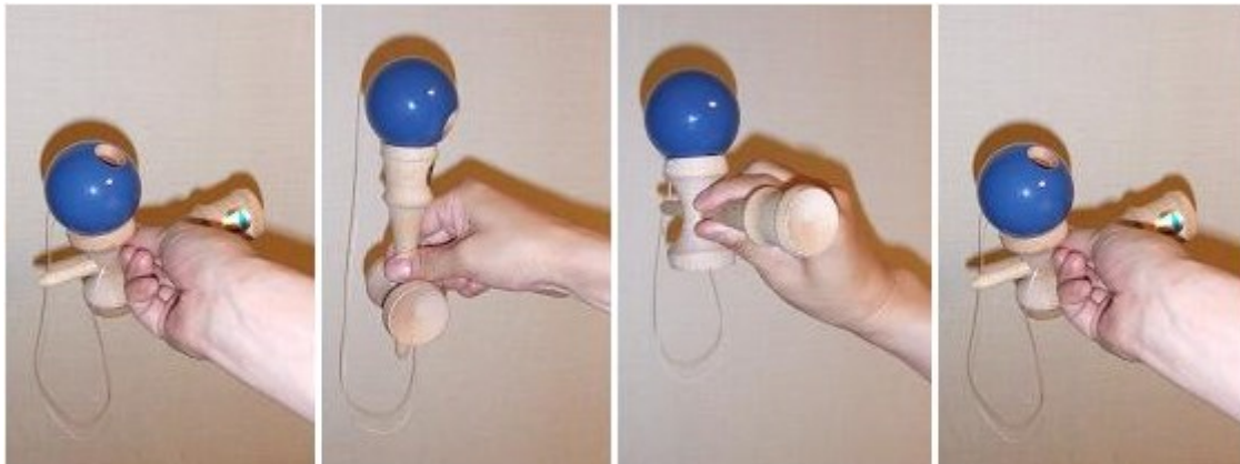
玉を大皿にのせてスタート。 まず中皿に、 つづいて小皿に、 最後に大皿に返って、完成。